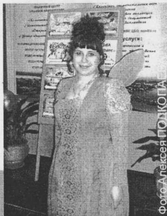
△ Библиотечная Фея

из посетителей с порога начал удивляться, а кто-то был заинтригован - что же дальше будет, если все так начинается? А дальше - кому что интересно. Многие девушки собрались у «Салона «Знаки судьбы», где мудрая цыганка по книгам предсказывала будущее. Тем временем кто-то украшал лицо на площадке «Фейс-арта», кто-то отгадывал загадки в «Шатре Шахерезады», а в «Музыкальной гостиной» каждый мог попробовать свои силы в поэзии и спеть любимые песни в караоке. Не пустовала ни одна площадка. И, конечно, даже в столь поздний час все желающие могли брать книги для чтения, а тех, кто записывался в этот вечер в библиотеку, ждал маленький презент.